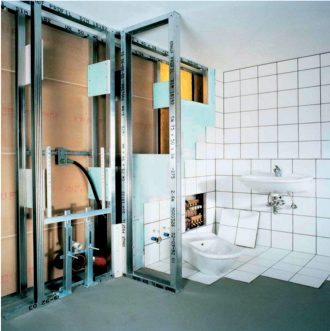
Fiche technique Plaque de plâtre Knauf